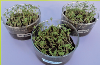
Abb.1: Gesamtproben ohne und mit Prüfkörper nach 5 Tagen

Für die biologische Abbaubarkeit von Kunststoffen spielt die Rohstoffherkunft, also die Tatsache ob fossile oder nachwachsende Rohstoffe bei der Herstellung des Produkts verwendet wurden, keine Rolle. Entscheidend dafür, ob ein Material biologisch abbaubar ist, ist ausschließlich seine chemische Struktur. Nur wenn Mikroorganismen und Pilze bzw. deren Enzyme die Moleküle, aus denen der Kunststoff besteht, spalten und vollständig verstoffwechseln können, ist dieser auch biologisch abbaubar. Biologisch abbaubare Kunststoffe werden durch Mikroorganismen vollständig zu Kohlendioxid (CO 2 ), Wasser (H 2 O), mineralischen Salzen und Biomasse zersetzt. In der Vergärung kann beim Abbau zusätzlich noch Methan (CH 4 ) entstehen.