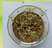
Prüfkörper 2 nach 11 Tagen