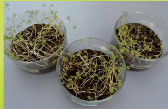
Abb. 2. Gesamtproben ohne und mit Prüfkörper Biodegradable nach 30 Tagen

In standardisierter Versuchserde unter aeroben Bedingungen wird über den gesamten Prüfzeitraum die biologische Aktivität anhand verschiedener Parameter (Temperatur, Bodenfeuchte) überwacht. Die Tests können wahlweise unter definierten Laborbedingungen oder unter praxisrelevanten Freilandbedingungen durchgeführt werden. Die Auswertung der Versuche erfolgt nach vorgegebener Prüfdauer über die Abbaurate von Produkten sowie die Umweltverträglichkeit, bzw. Umweltbelastung durch verrottende Produkte (über ökotoxikologische Untersuchungen oder chemische Analyse). Für diese Endparameter werden jeweils standardisierte Verfahren eingesetzt.