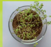
Prüfkörper 1 nach 11 Tagen