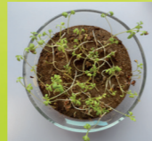
Originalprobe nach 11 Tagen

In standardisierter Versuchserde unter aeroben Bedingungen wird über den gesamten Prüfzeitraum die biologische Aktivität anhand verschiedener Parameter (Temperatur, Bodenfeuchte) überwacht. Die Tests können wahlweise unter definierten Laborbedingungen oder unter praxisrelevanten Freilandbedingungen durchgeführt werden. Die Auswertung der Versuche erfolgt nach vorgegebener Prüfdauer über die Abbaurate von Produkten sowie die Umweltverträglichkeit, bzw. Umweltbelastung durch verrottende Produkte (über ökotoxikologische Untersuchungen oder chemische Analyse). Für diese Endparameter werden jeweils standardisierte Verfahren eingesetzt.